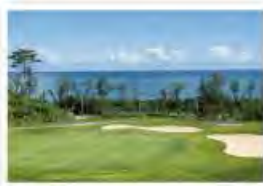
Гольф-клуб Энаджик Седаке