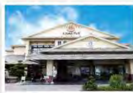
Горячие источники Энаджик (Aroma)